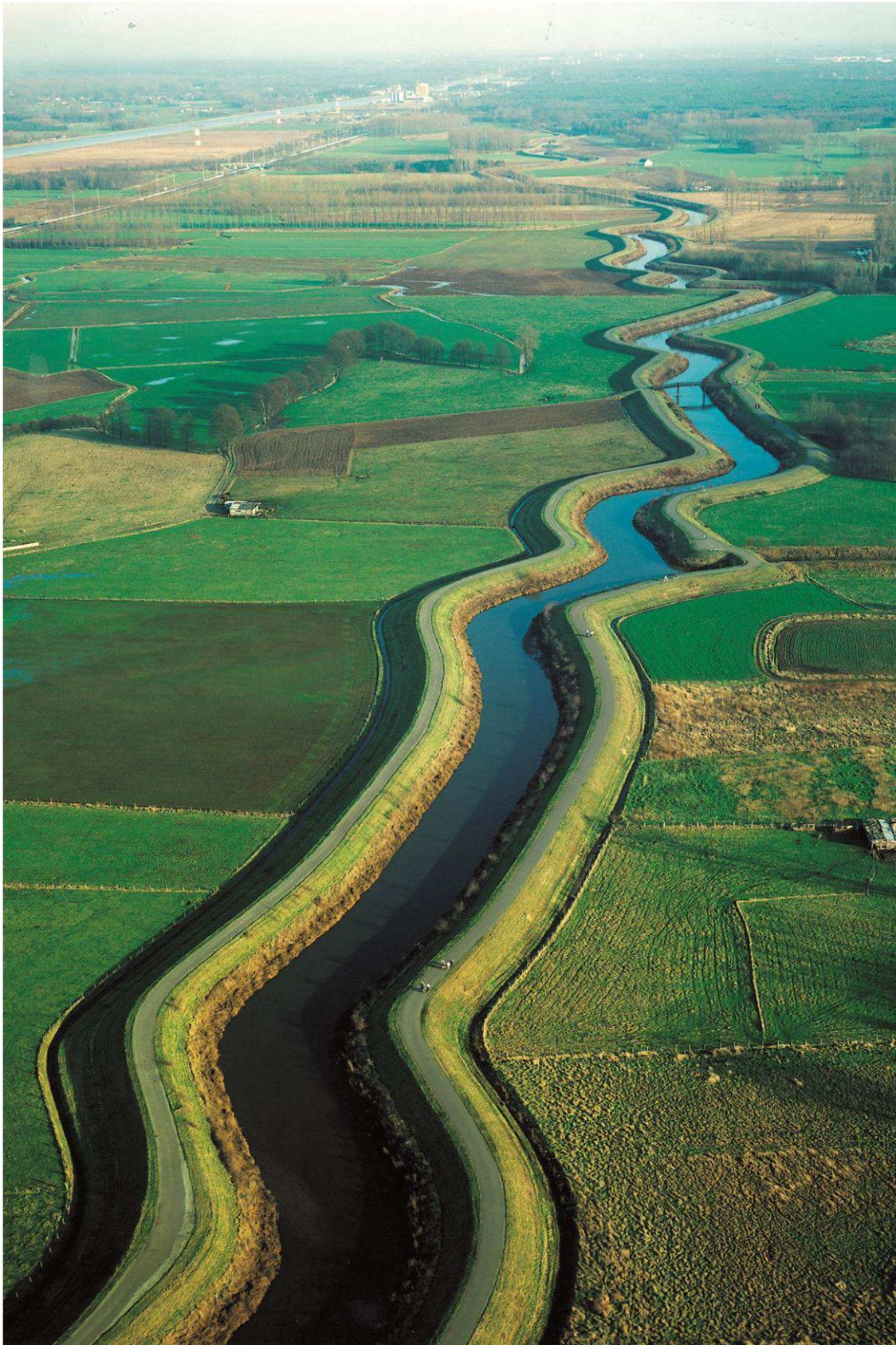
Figuur 4: Impressie van de vallei van de Kleine Nete ter hoogte van een gepland overstromingsgebied, onderdeel van de coördinatieopdracht voor de vallei.