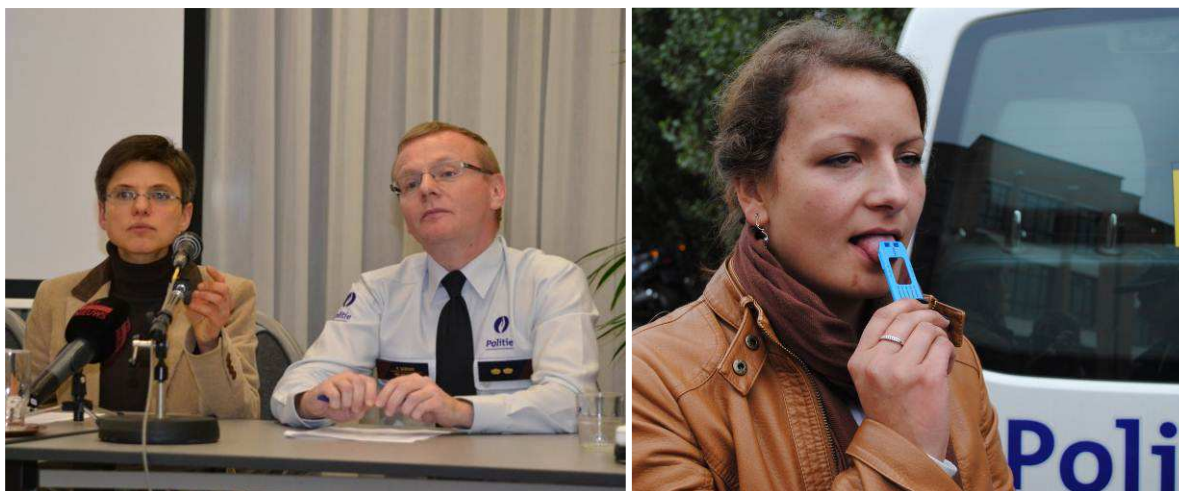
Figuur 6: bekendmaking WODCA-resultaten (links) speekseltest (rechts)

De WODCA-acties staan en vallen met de medewerking van de politiediensten. Zij zetten zich elk weekend actief in om controles te organiseren en uit te voeren. Zij delen ook alcoholtesters uit en sensibiliseren zij jong en oud over de gevaren van rijden onder invloed.