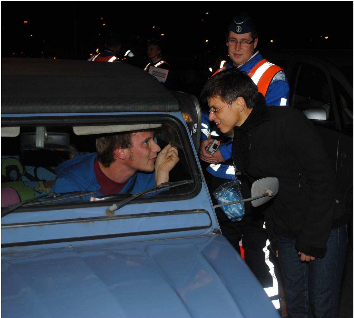
Figuur 7: WODCA-controle

Noorderkempen, Schoten, Voorkempen en Zara of een deel ervan. De studie loopt tussen 11 september 2013 en 20 maart 2014 en wordt op 25 maart 2014 als rapport opgeleverd. De studie geeft eveneens uitvoering aan een aantal aanbevelingen in het raam van de regioscreening 8 .