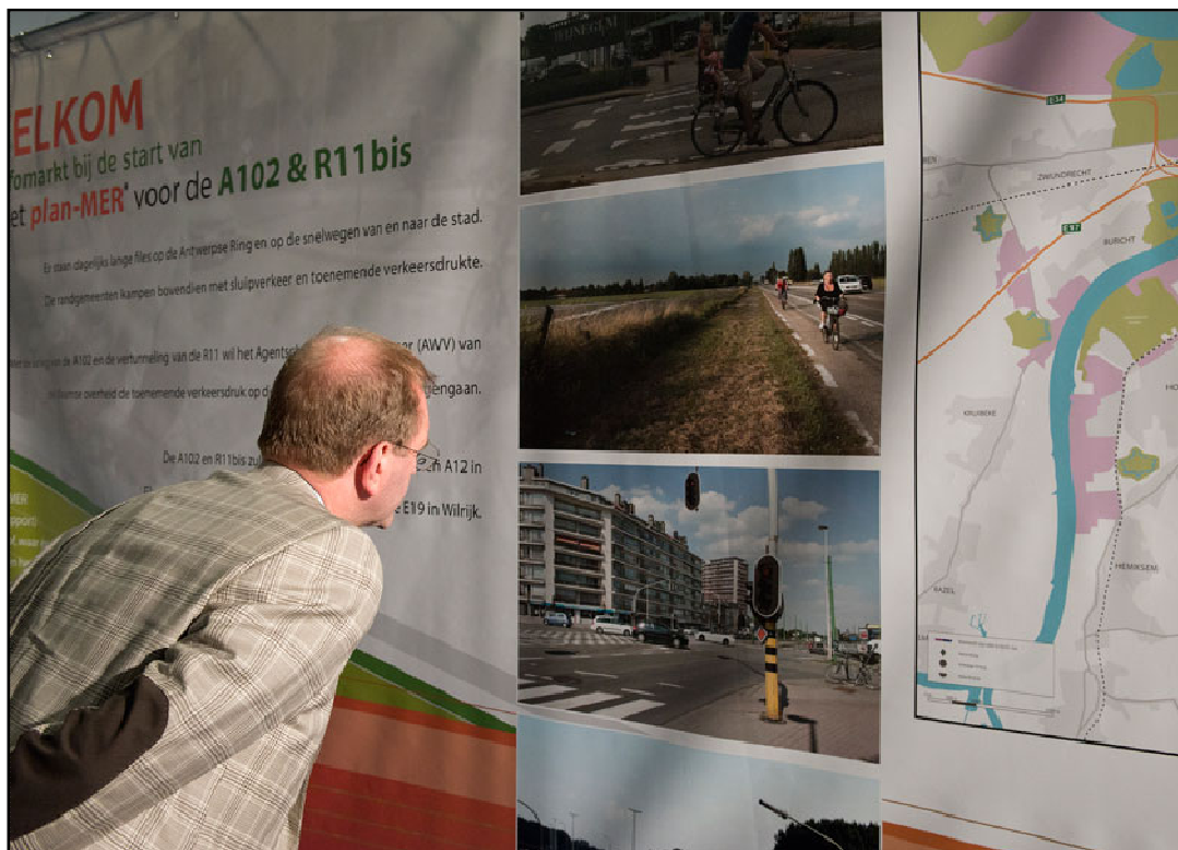
Figuur 2: infomarkt A102 – R11bis