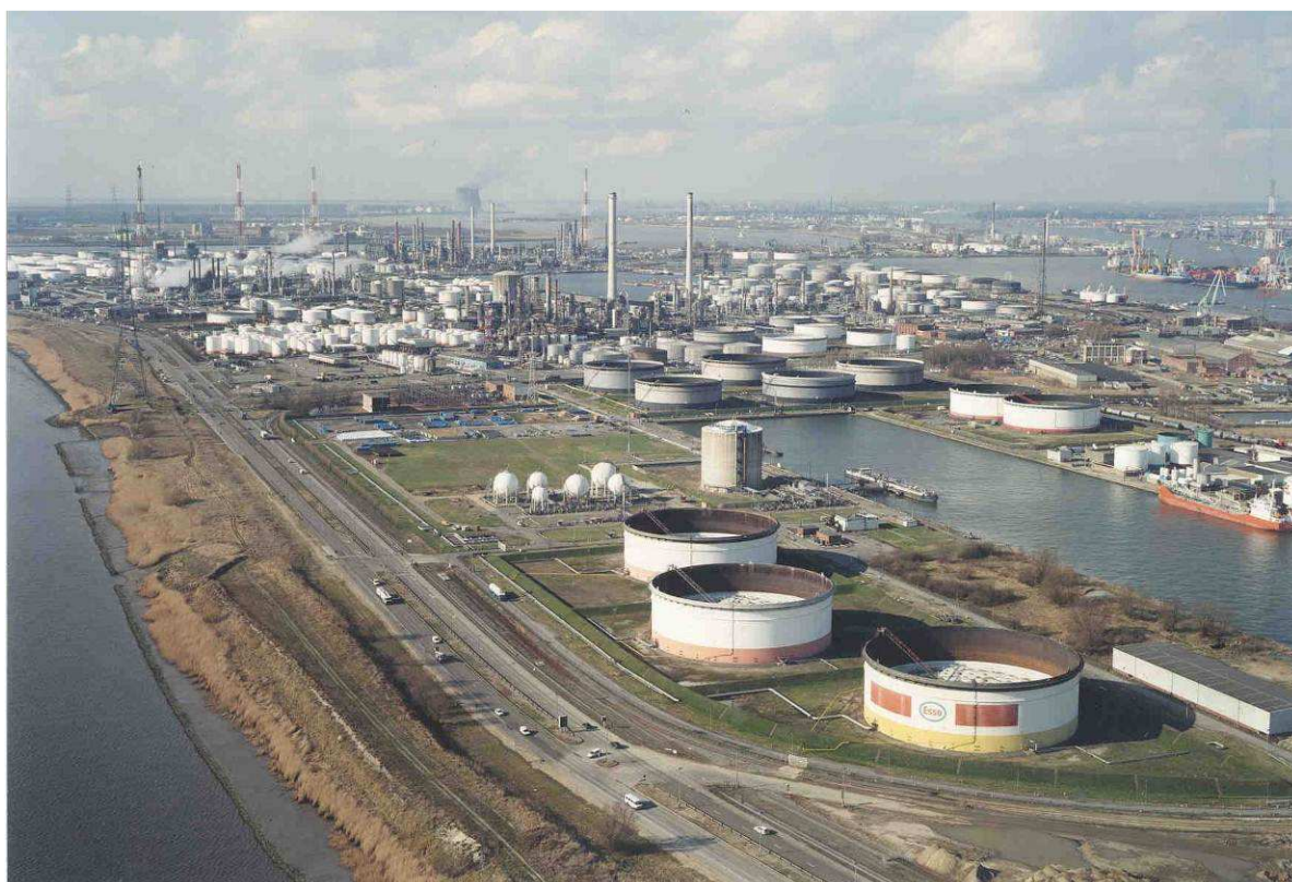
Figuur 5: Impressie bedrijfssite Exxonmobile Antwerpen